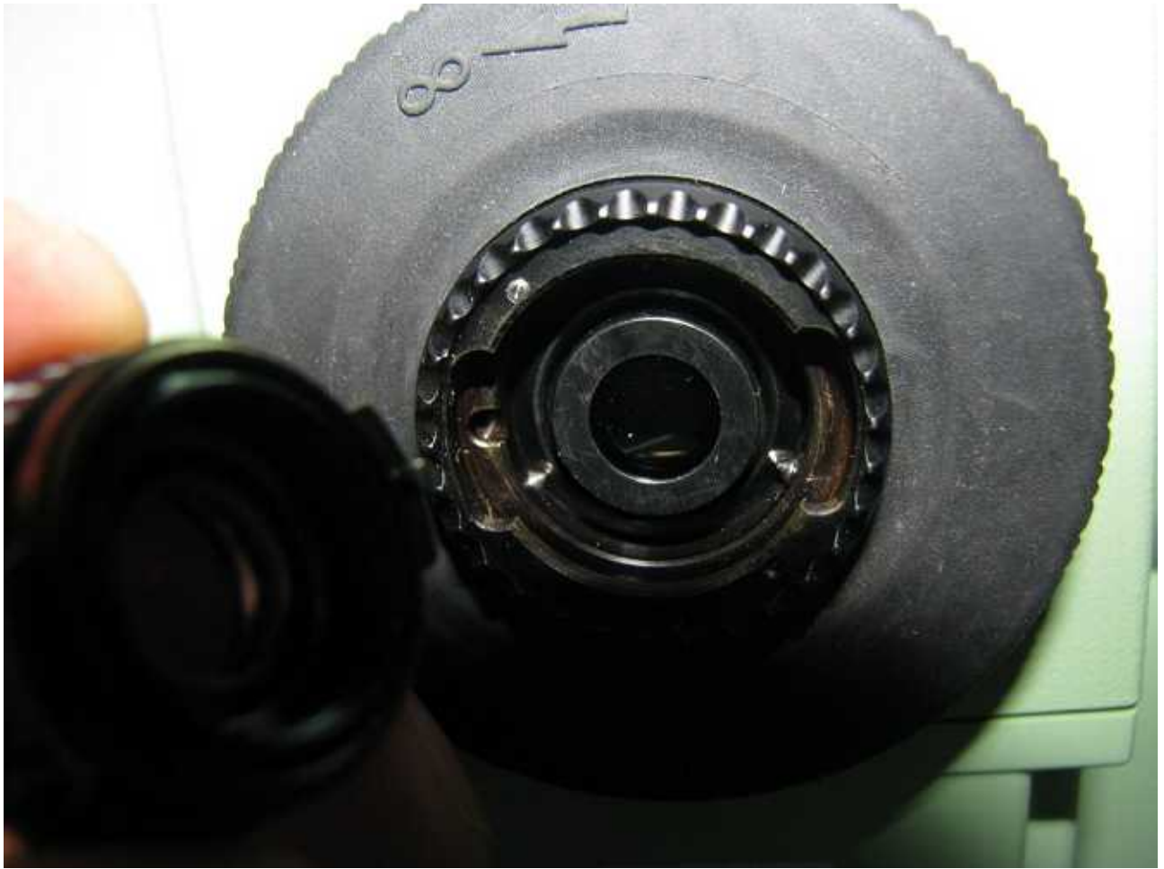
接眼レンズが外れた状態