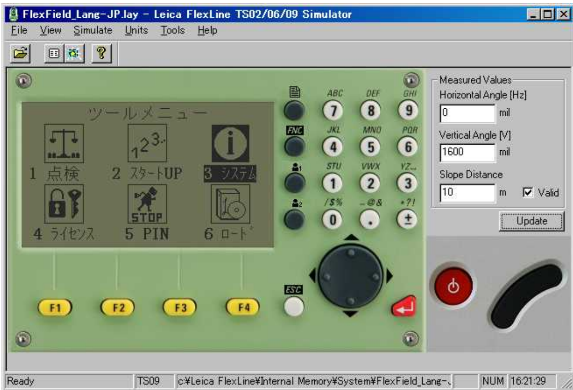
ツールメニュー 3 システム